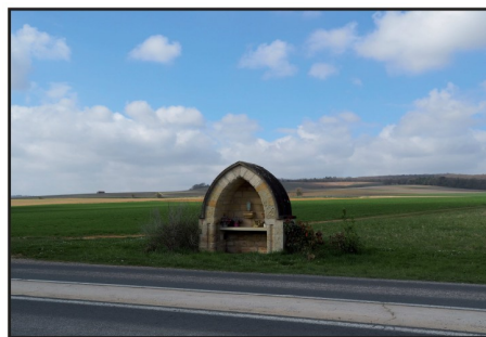
Autel, entrée de Tauxières