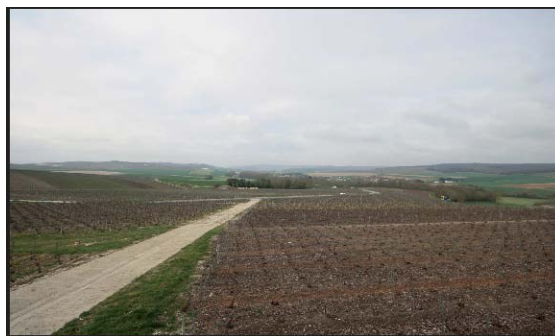
Panorama depuis le point de vue le long de la RD34