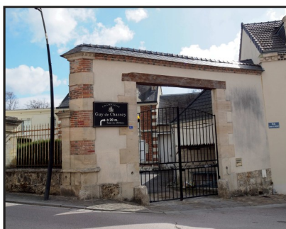
Portique - Rue Michel Letellier